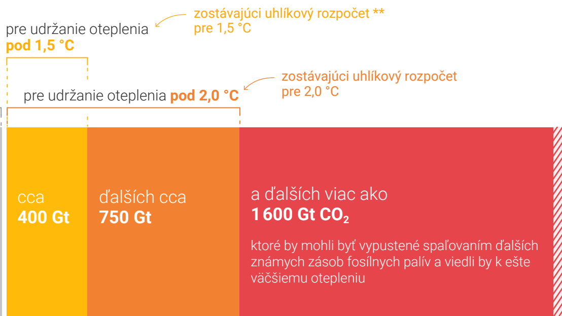
Globálne emisie CO 2 z ďalšieho spaľovania fosílnych palív